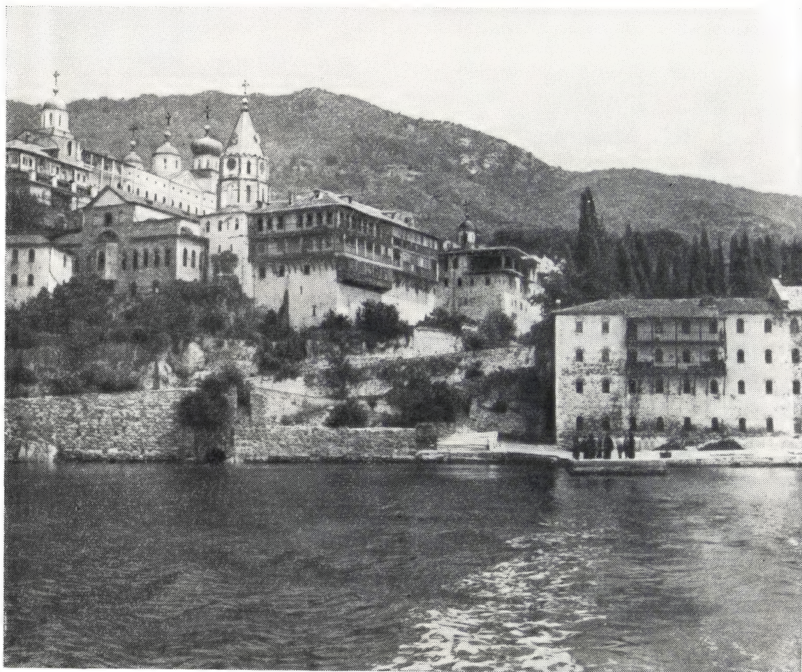
Русский монастырь Святого великомученика и целителя Пантелеимона на Афоне. 1973 г.

телей русских древностей на Афоне — архимандрита Антонина Капустина (Заметки поклонника Святой Горы, с. 293), иеромонаха Азари (Путеводитель по Святой Горе Афонской, с. 154—158; Акты Русского на Святом Афоне монастыря, с. 5—6), академика Е. Е. Голубинского (История Русской Церкви, т. I, пол. 2, с. 571). Афонское предание связывает пострижение преподобного Антония с Есфигменским монастырем. Действительно, на территории Есфигмена находится пещера, в которой спасался основатель русского монашества. У епископа Порфирия Успенского в его знаменитых дневниках находим такое сообщение: «1858 г. 10 июля, четверток. Сегодня я слушал обедню в церкви святого Антония Киевопечерского, построенной в 1852 году на приморском утесе подле Есфигмена, где будто бы подвизался в пещере оный Антоний в бытность свою на Афоне» (Книга бытия моего, ч. VII. СПб., 1901, с. 175). Существует также мнение, что преподобный Антоний принял постриг в Иверском грузинском монастыре (епископ Кирион. Культурная роль Иверии в истории Руси. Тифлис, 1910, с. 83—95).